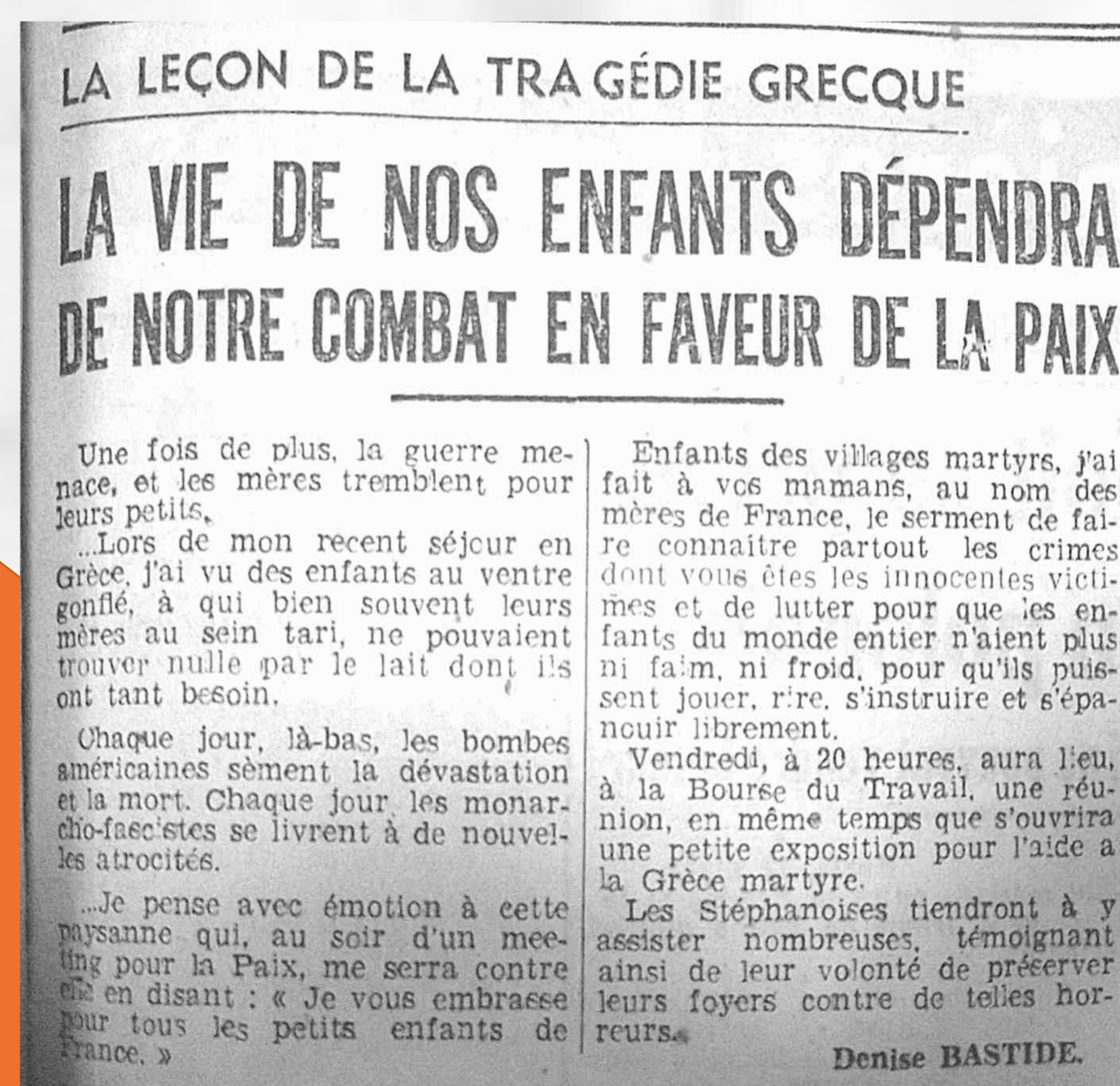
23/03/1949 - Le Patriote