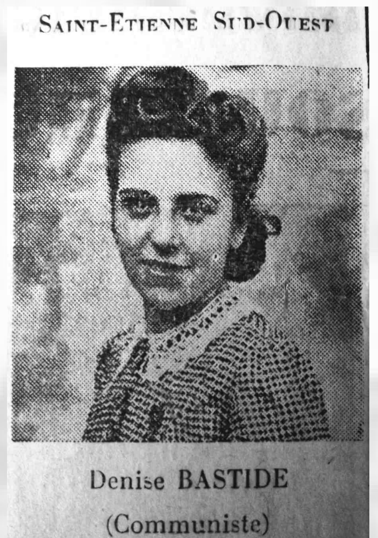
22/09/1945 - Le Cri du peuple