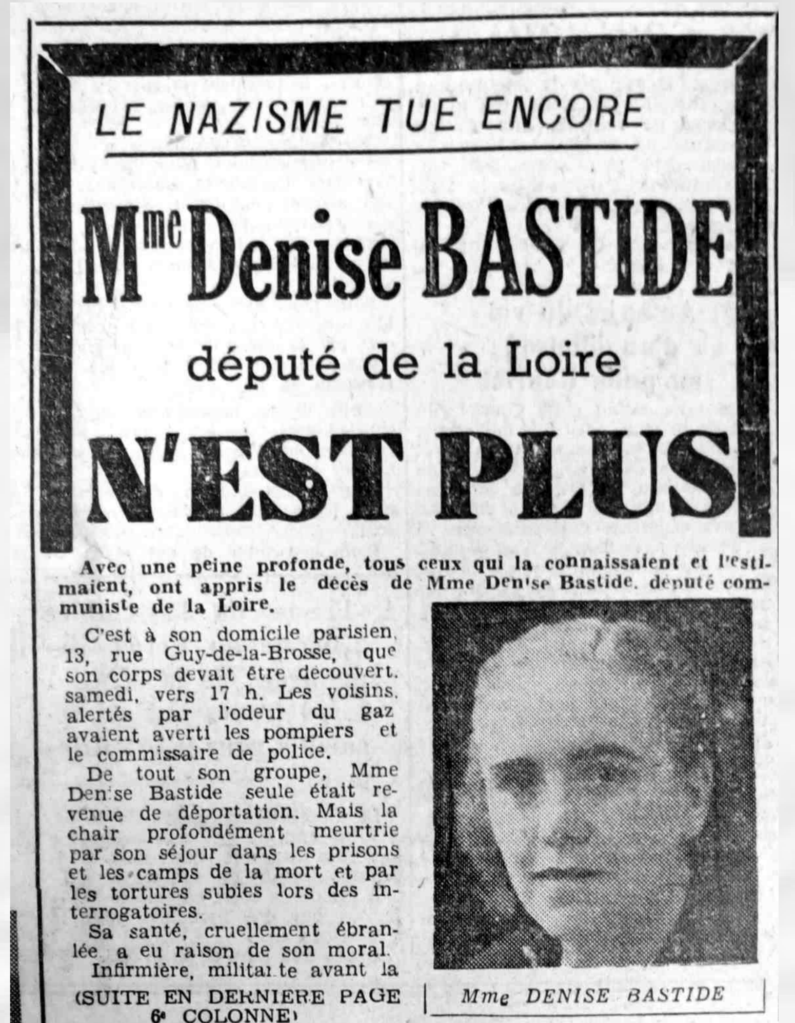
03/03/1952 - Le Patriote

Sources des textes : dictionnaire Maïtron